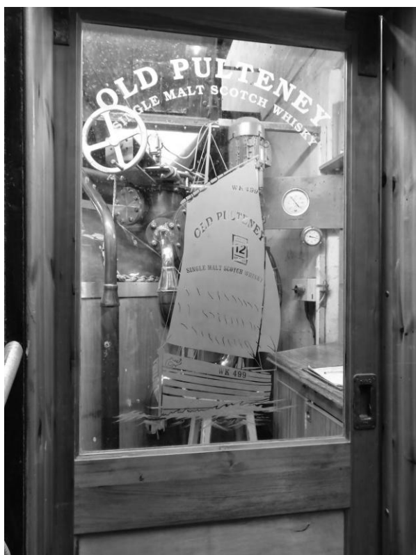
In de Pulteney distilleerderij maken ze dus 'Old Pulteney' whisky.