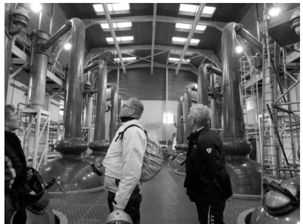
Prachtig koperen stookketels. Aangezien het buiten niet enorm warm was, was het een aangename bijkomstigheid dat het natuurlijk goed warm is in zo'n stokerij.