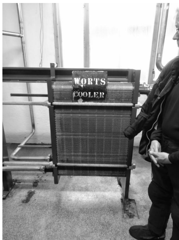
Het 'wort' (bierbeslag) moet worden gekoeld omdat anders het later bijgevoegde gist zou sterven van de hitte.