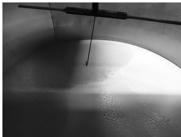
Gist in actie. Het lijkt te koken, maar in feite worden de suikers in het water door de gist omgezet naar alcohol.