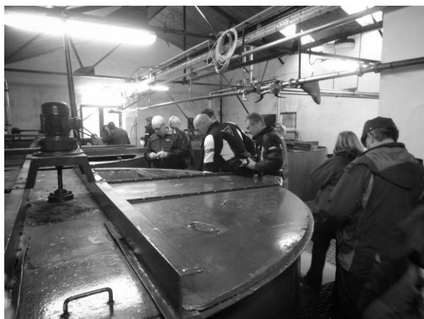
Grote 'washbacks' waarin het 'wort' aan het gisten is. Elke washback bevindt zich in een ander stadium, zodat er elke dag een washback leeggemaakt kan worden om gestookt te kunnen worden.