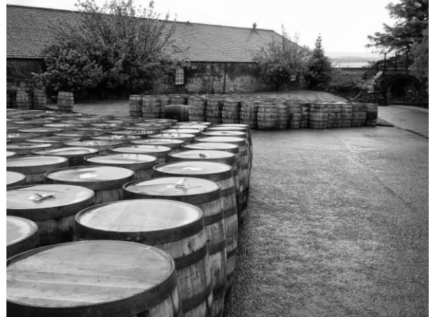
Mooie verzameling van (ongevulde) vaten.