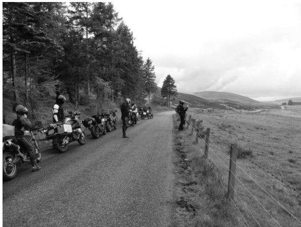
Links nog wat bossage, verder in de achtergrond het ruige landschap waar weinig bossen meer te vinden zijn.

Het was trouwens goed te merken dat we steeds verder de Highlands inreden, bossen maakten plaats voor struikgewas, heide en rotsachtige formaties.